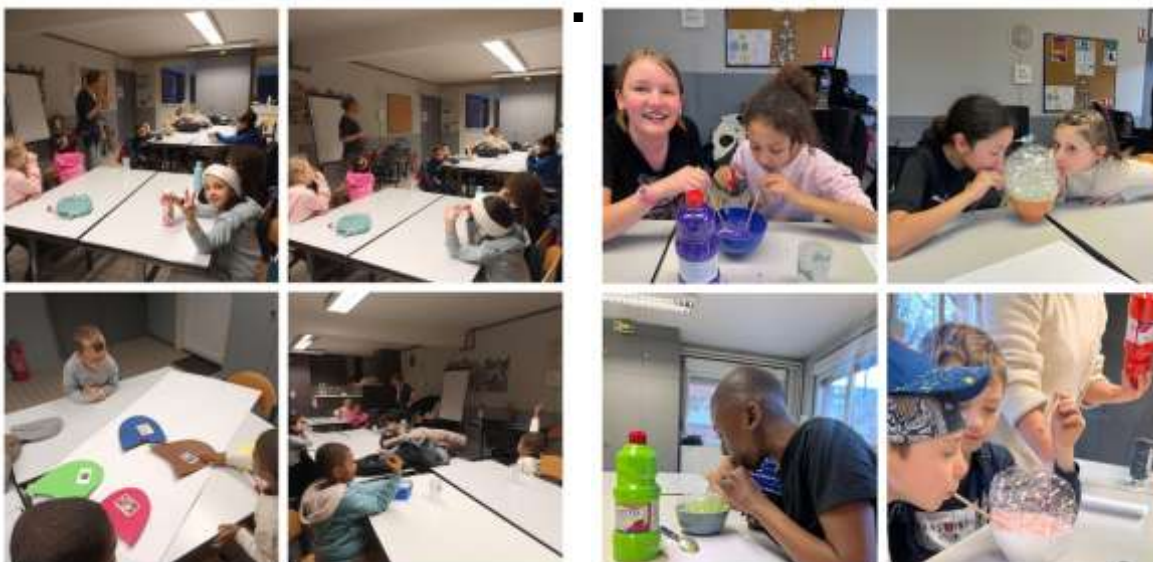
Ateliers avec une diététicienne