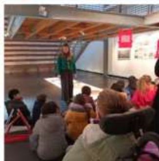
Spectacle/Activités sportive et manuelle