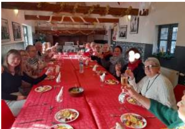
Repas de Noël