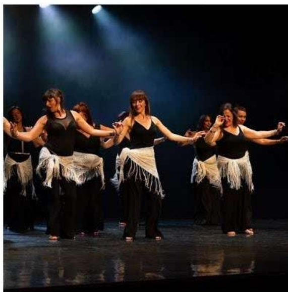
Gala de danse du 2 juillet