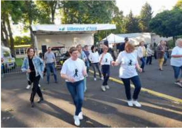
Les allumoirs vendredi 8 novembre 2024