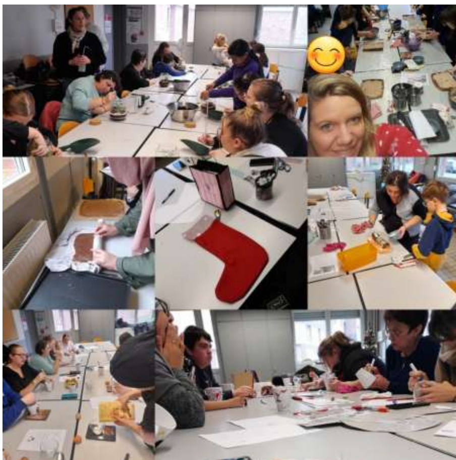
Les Stages parents/enfants des vacances de fin d'année 2024