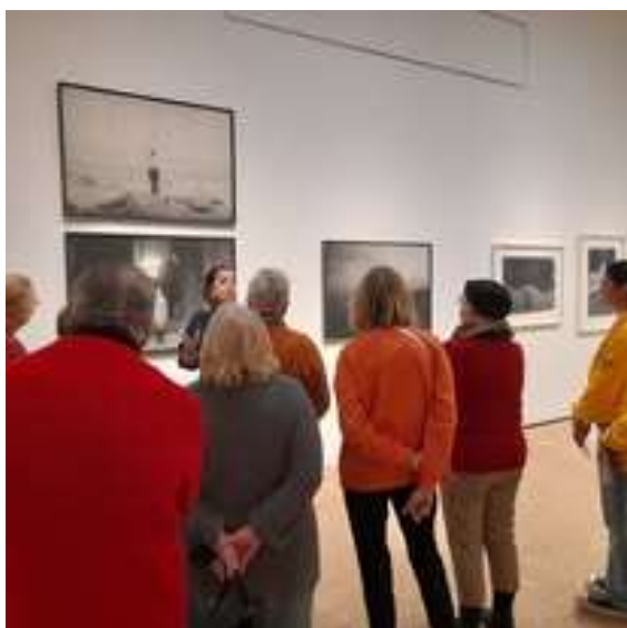
Visite au musée du LaM