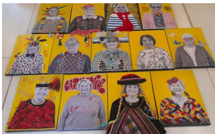
Tableaux avec broderie