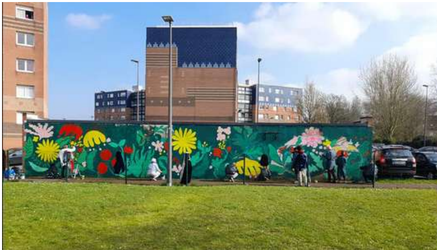
Réalisation d'un graff