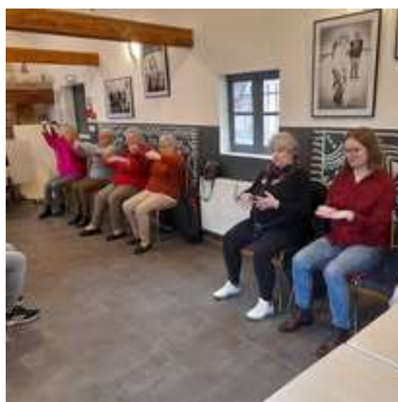
Atelier Qi gong