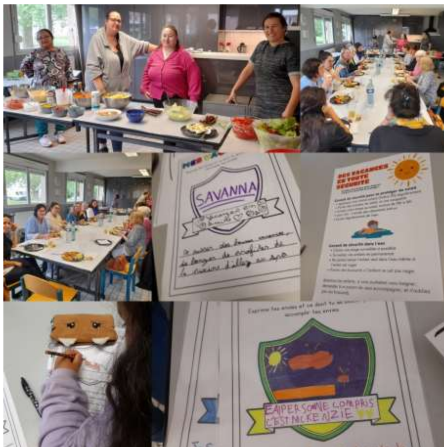
Autofinancement et préparation séjour

Remarque : organisation d'un projet vacances tous les 2 ans.