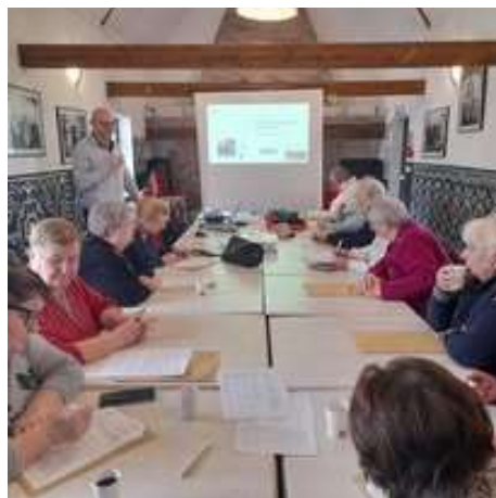
Adapter son logement - SOLIHA