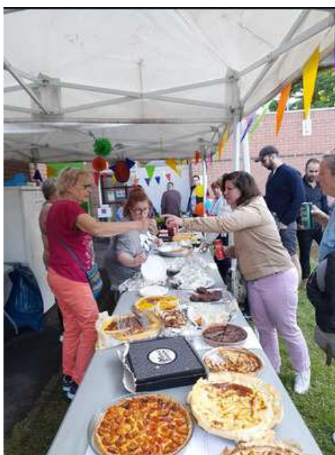
Fête de la musique le 21 juin 2024