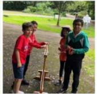
Jeux rose des vents