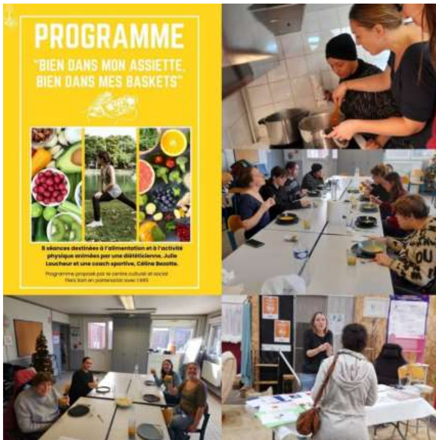
Des actions de prévention pour une alimentation saine et équilibrée à chaque âge !