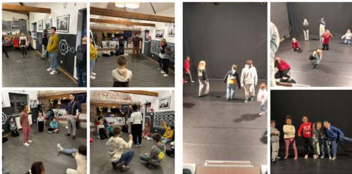
Théâtre avec la compagnie Quanta